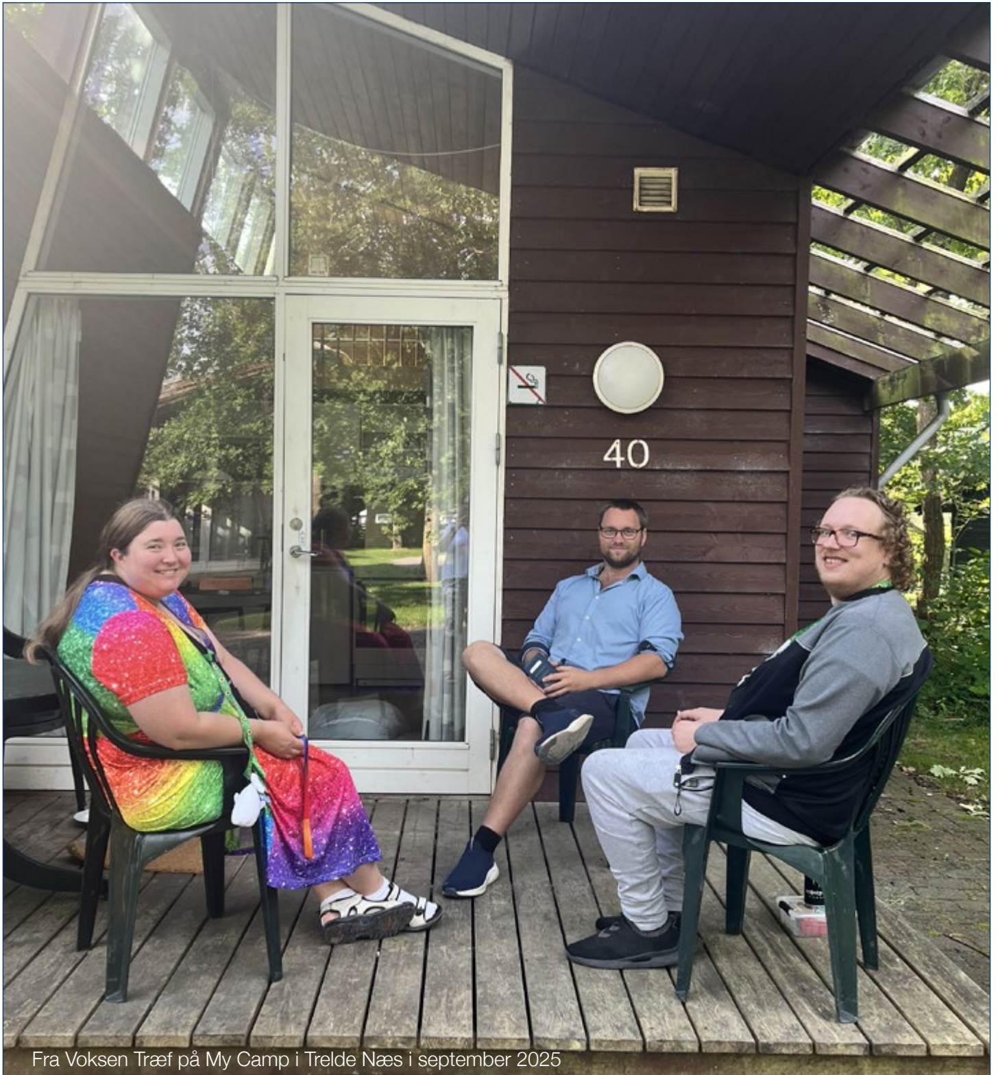
Fra Voksen Træf på My Camp i Trelde Næs i september 2025